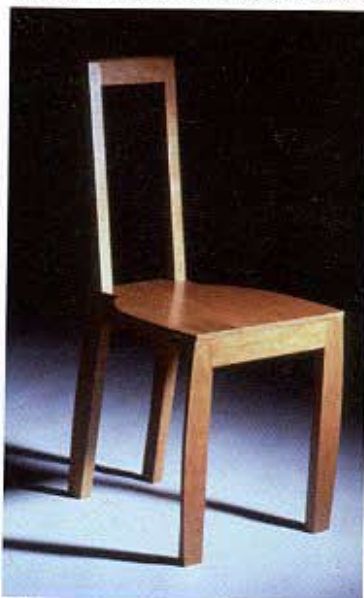
Chaise en sycamore, 1995